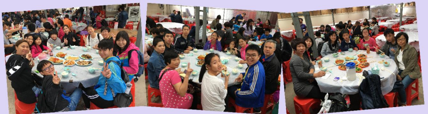
大家享用了一頓美味的午餐