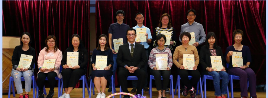
家職會幹事大合照