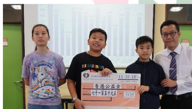
校長在公益金便服日與學生合照

何謂「慈悲喜捨」？佛陀能做教化的工作，全依靠這四個字，「慈、悲、喜、捨」，教師及家長教育孩童也同樣是一項艱巨的教化工作，讓我們今天一起來認識這四個字。