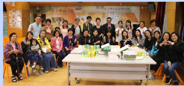
家長在典禮後茶聚