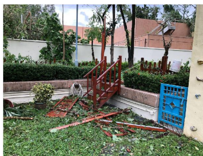
山竹來襲後的校園