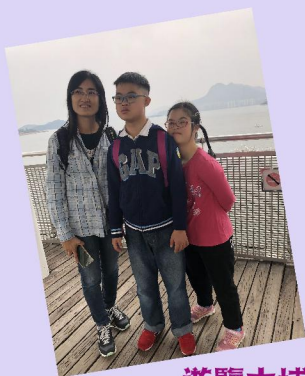
遊覽大埔海濱公園