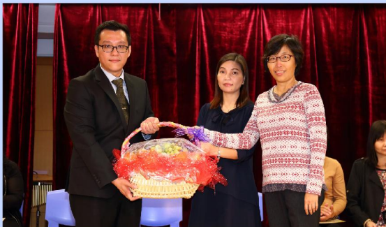
家職會正副主席贈送水果籃予本校教職員