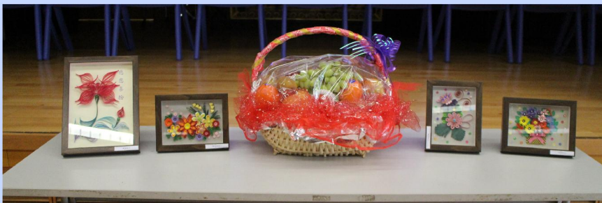
家職會幹事準備了紀念品予各教職員