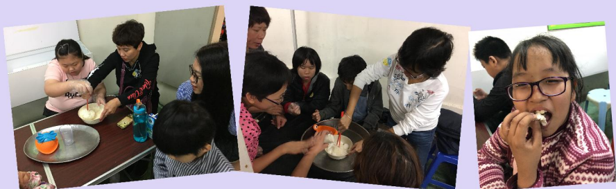
大家很努力製作鳥結糖