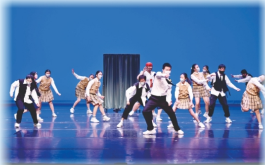
學生們默契十足，展現了出色的技巧。