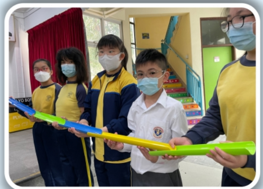
歷奇訓練建立團隊精神，完成任務我做得好!