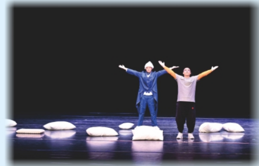
兩位同學動作協調，表情生動。