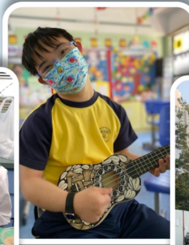
音樂治療讓音樂觸動 人心，陶冶性情!