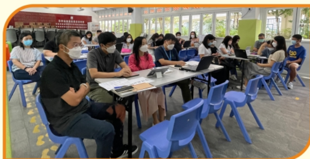
教職員專業發展日(一)校外評核預備工作