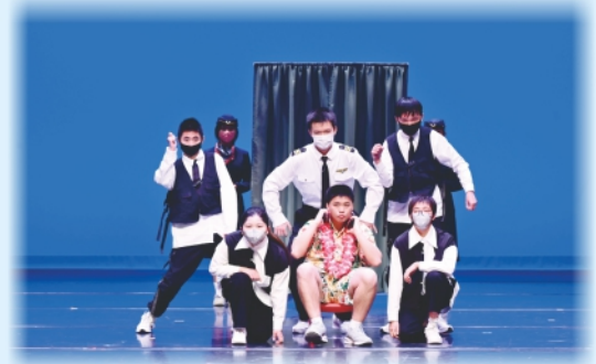
男乘客正在機上享受旅途的喜悅，忽然間風雲色變，危險降臨。

雙人舞「睡魔來了」，兩位學生表現出一隻極具感染力和韻律感的舞蹈作品，他們的動作協調，表情生動，讓評判都為之感動。而群舞「九宵驚魂之幻想曲」，在比賽中學生們彼此配合默契，呈現出一隻極具視覺效果和藝術感染力的舞蹈作品。