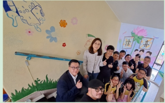
壁畫啟動儀式大合照