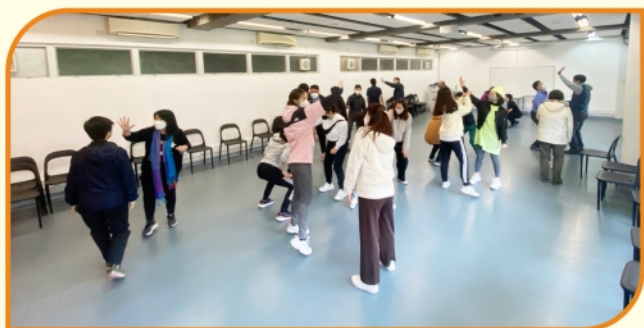
教職員專業發展日(二)歷奇活動