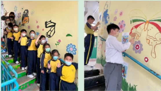
初小學生繪畫壁畫的情況