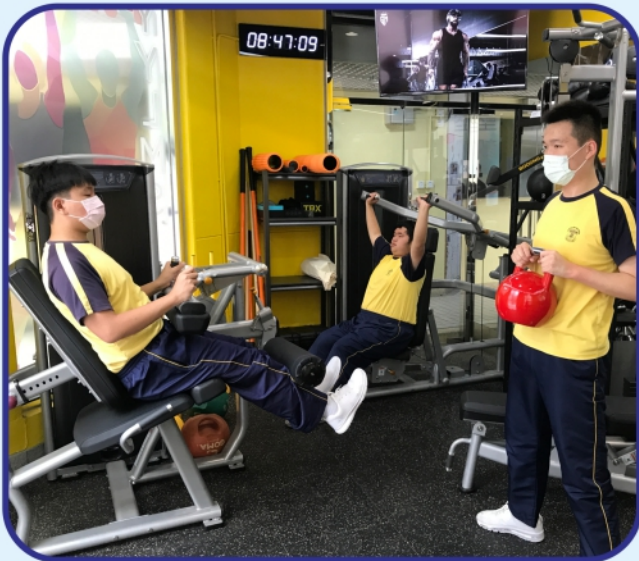
疫情後更要強身健體，保持健康