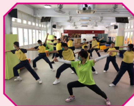
同學們認真地學習 「五形拳」，表現有板有眼