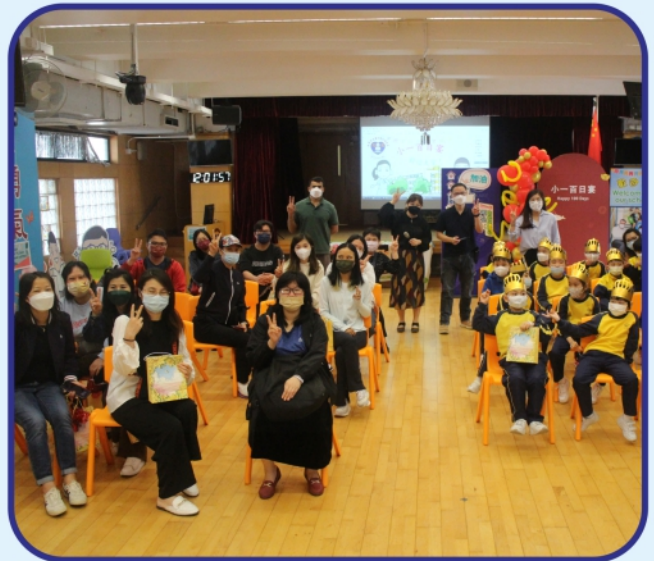
除百日之喜，本校小一學生也渴望全日課的來臨