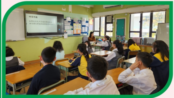
學生和老師先在課室進行分組及分工研習主題

這次專題研習主要是延續去年水耕活動。學生已初步認識水耕是以科學化方法控制植物的生長，包括運用不同設備控制溫室的溫度、濕度和營養比例。高小的學生於「日霖水耕天地」及課室作對照實驗，分別觀察營養、空氣和陽光對植物生長的影響。