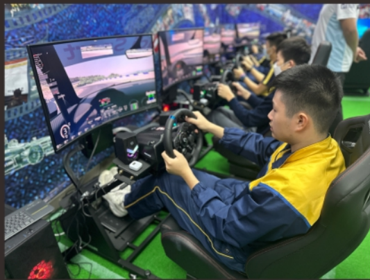
隊員進行賽道練習

電競隊隊員用心學習，投入練習，積極參與訓練之餘，亦會在課程社工指導下加強團體合作的精神。他們將於8月參加公開比賽，期待他們取得好成績。