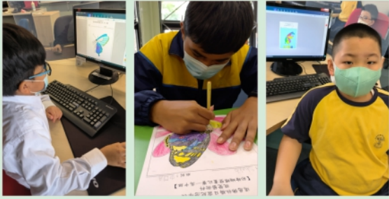
學生可選用傳統媒介或數碼繪畫軟件繪畫蝴蝶畫作