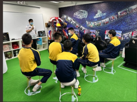
導師講解賽車理論及技巧