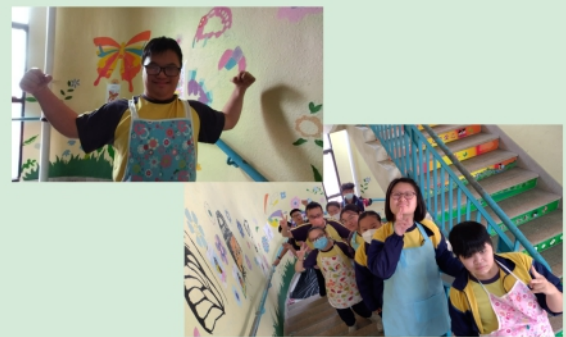
高中學生繪畫壁畫的情況