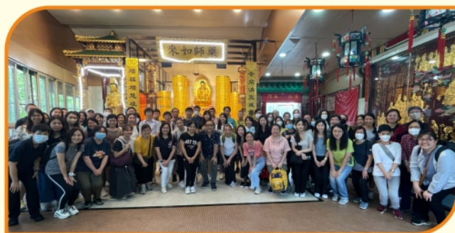
教職員專業發展日(三)到訪道慈佛社