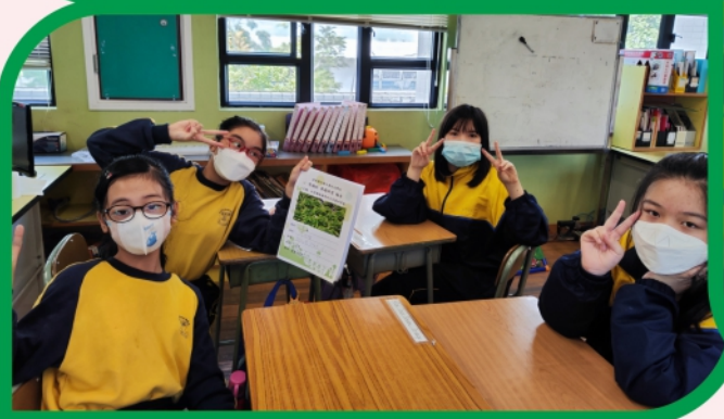
學生進行資料整理及分析