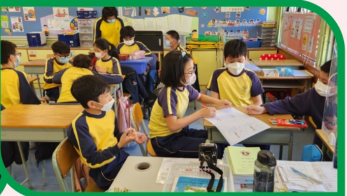
學生在匯報日十分投入