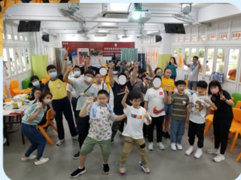
兒童發展基金友師及學生再次 相聚，當天的遊戲及交流環節， 令大家十分盡興。