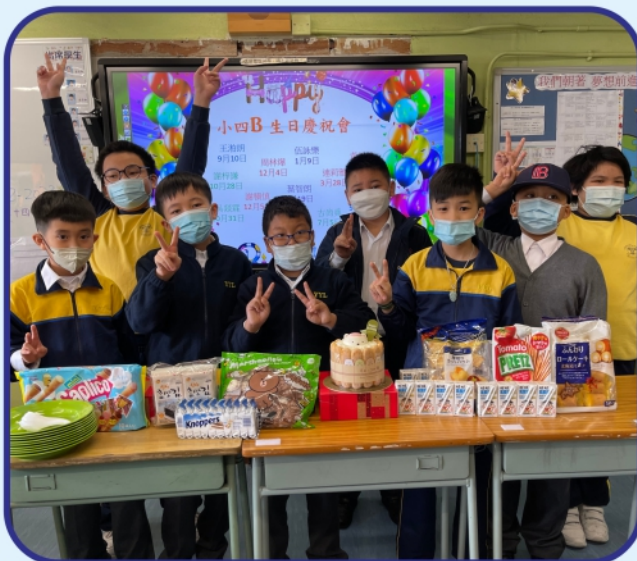
久違的生日會可以再次舉行了