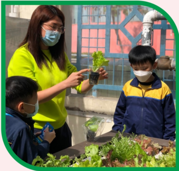
老師介紹如何觀察植物的生長