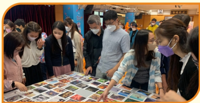
11月份正向教育工作坊—與情緒對話

教職員專業發展日(三)教職員會到訪辦學團體—道慈佛社，同日亦進行了國民教育及國家安全教育相關的研習活動，期望為學校帶來相關的資源。