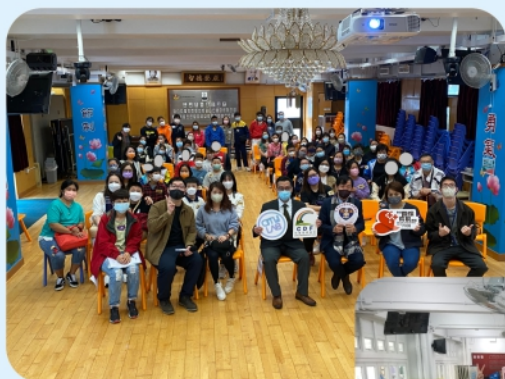
兒童發展基金 啟動禮於2月舉行， 計劃正式開始。

蓄」、「師友配對」及「個人發展規劃」。本校有28位學生參與儲蓄計劃，友師與學生及家長已成功配對及彼此認識。本校期望這三年計劃能順利推展，令學生及家庭受惠。