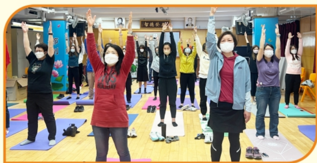
3月份正向教育培訓-精神健康與自我照顧