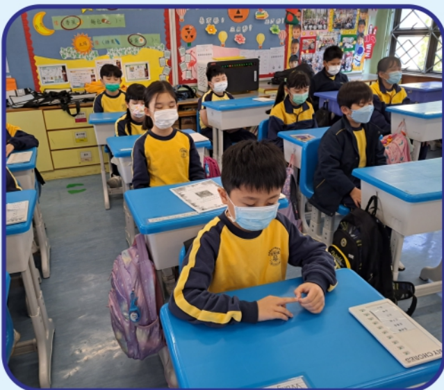
學生進行靜觀練習