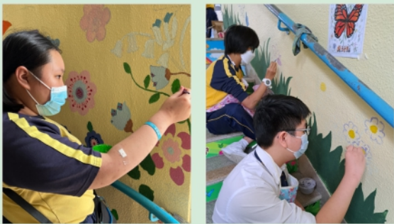
初中學生繪畫壁畫的情況