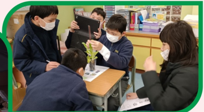
透過觀察及記錄植物在不同環境下的變化