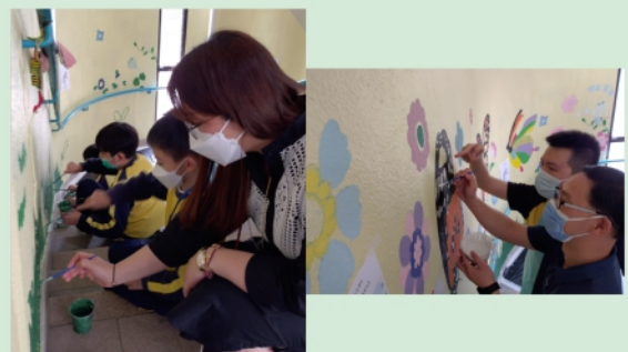
教職員繪畫壁畫的情況