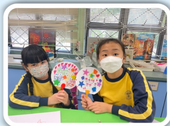
繪畫樂園的學生用心創作!