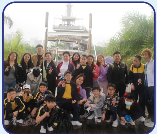
大家期待已久的全校旅行