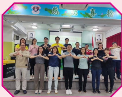
簡單的一個敬禮， 也傳承了傳統武藝精神和禮節

計劃分兩部份，第一部份「武藝操」：以1-2套「武藝操」為全校普及課程，融合於體育課及早會。第二部份開設「學生武藝興趣班」，提供五至六種武藝課程，加深學生對中國武藝文化和中國倫理道德的認識，讓學生體驗和感受由武術引伸而來的生活價值觀、人生觀乃至民族意識。