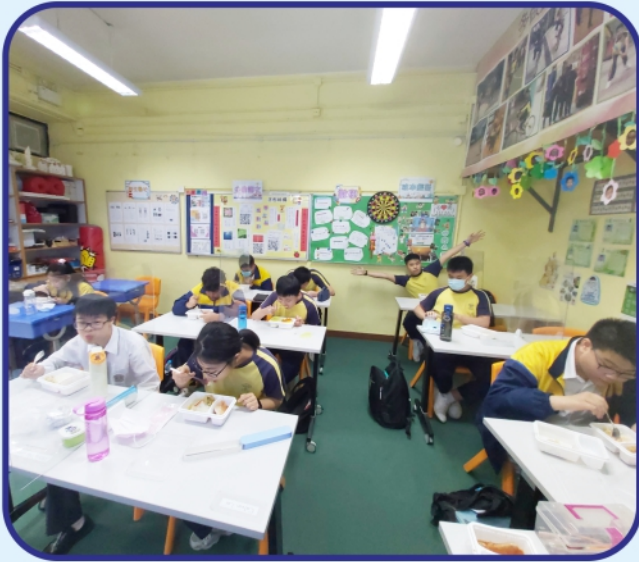
學生可以安心地在學校裡享用午膳