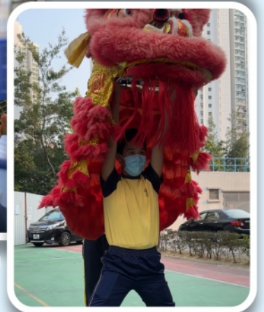
龍獅藝隊準備在 浴佛節及 校運會大顯身手!

隨著疫情措施放寬，課後活動亦隨即展開。本校因應學生不同的潛能和需要，提供了不同種類的課後活動並分為專項及非專項兩個模式進行。