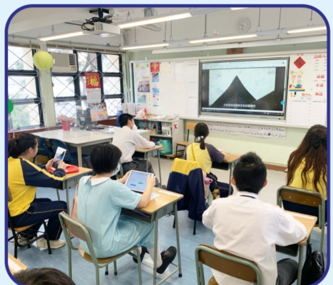
午後的課室再度熱鬧起來