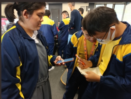
隊員記錄圈速及分析結果