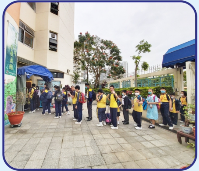
每天學生都期待回校上課