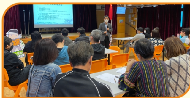
1月份評估理論及評估素養工作坊