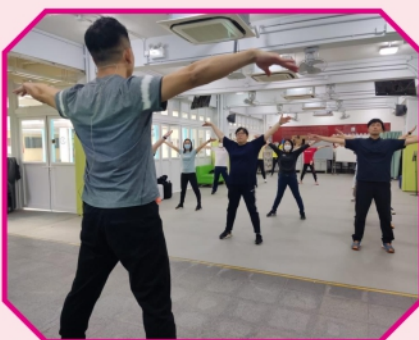
老師們精神抖抖地 學習「武藝操」