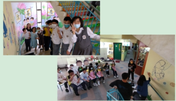
高小學生繪畫壁畫的情況