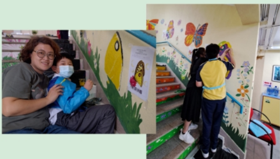
親子組繪畫壁畫的情況