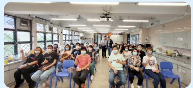
第一次家長講座於3月順利完成，講者 風趣幽默的表達，令家長十分投入。