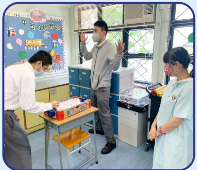
課室裡瀰漫著學生的歡笑聲