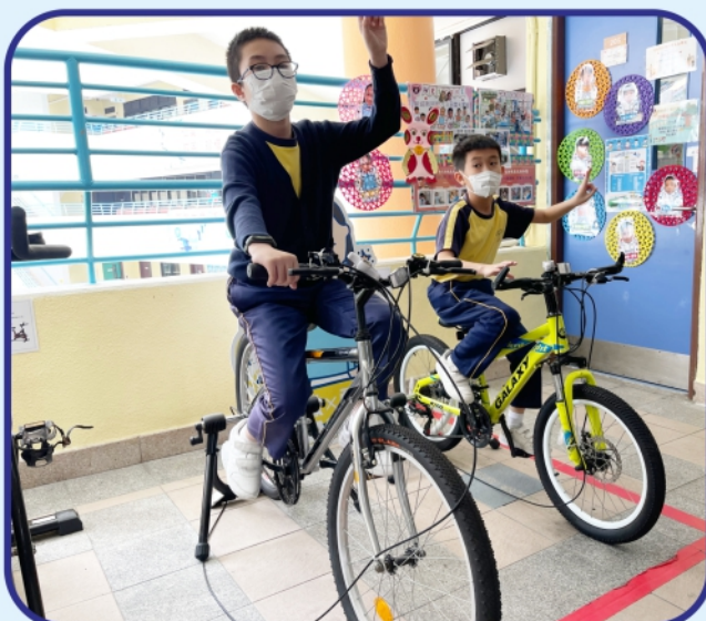
小息時，單車運動區都充滿了活力