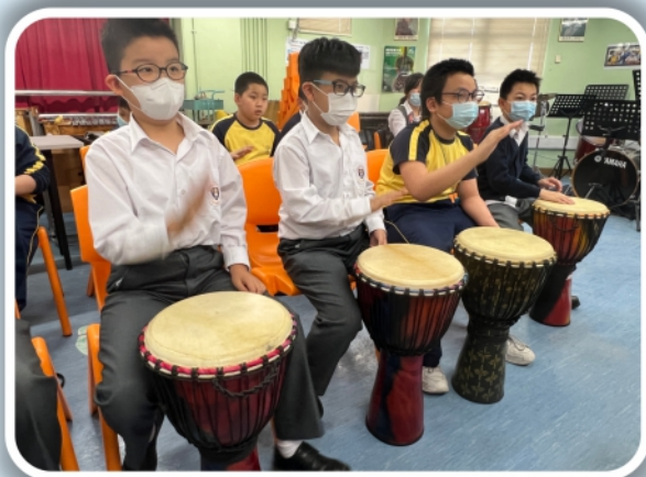
非洲鼓組的學生齊齊拍打非洲鼓， 發出悅耳的鼓樂聲!